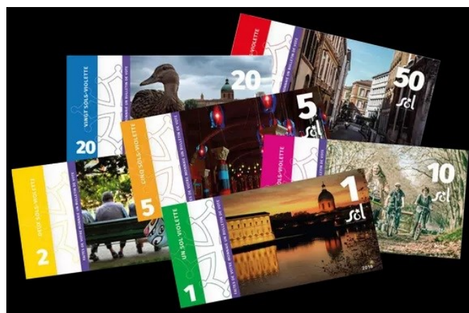
Le SOL violette de Toulouse.