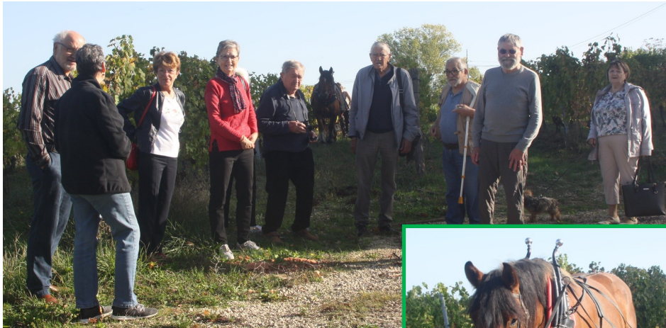
Le groupe attendant l'arrivée de l'attelage utilisé pour buter les pieds des vignes.